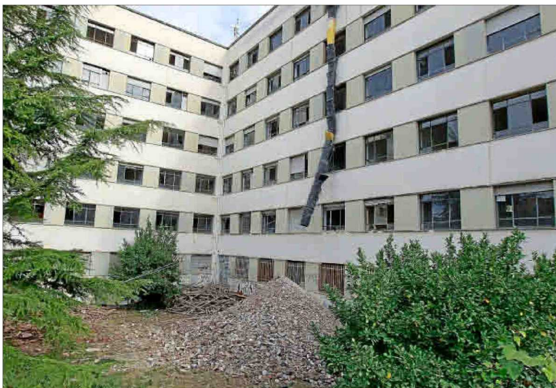
Escombros de las obras en el jardín de la antigua Facultad de Ciencias, cuyo ala norte se está vaciando.

borará el proyecto de construcción del aulario, que aún no está terminado. «Nuestro objetivo es que en el torreón se concentre un grandísimo porcentaje de los estudios de la Escuela de Ingenierías Industriales», indicó. La distribución anterior no servía por cuestiones estructu-