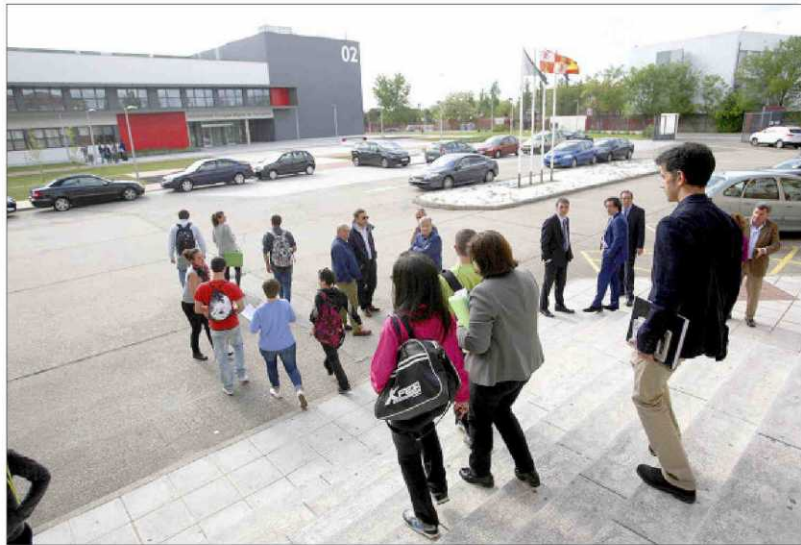
Alumnos en la Universidad Europea Miguel de Cervantes.

Las últimas estadísticas disponibles por el Ministerio, correspondientes al curso académico 2015-2016, permiten comprobar que el 41% del alumnado de máster en la Comunidad tenía menos de 25 años